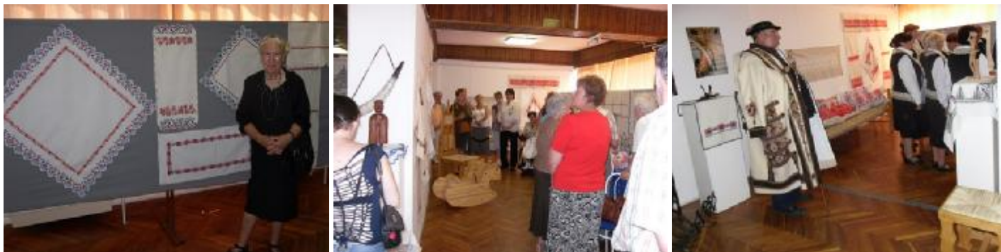
Néhány pillanatkép az eseményről