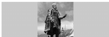
GARAY János (1812-1853)