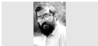
BAKA István (1948-1995)